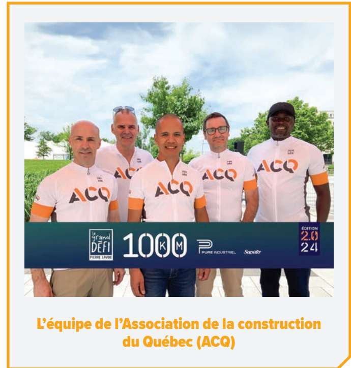
L'équipe de l'Association de la construction du Québec (ACQ)

Mentionnons aussi la contribution d'Ohana et de Clarins.