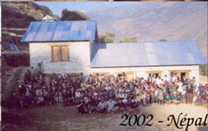
2002 - Népal