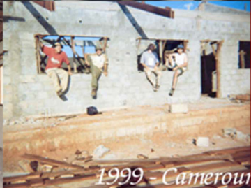
1999 - Cameroun