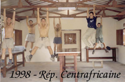
1998 - Rép. Centrafricaine