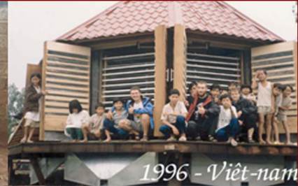
1996 - Viet-nam