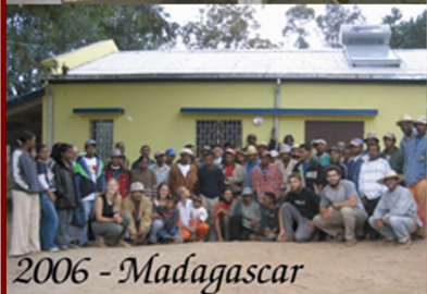
2006 - Madagascar