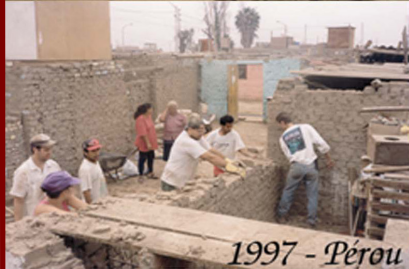
1997 - Pérou