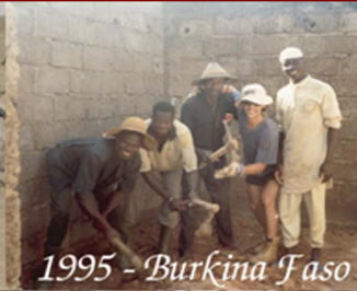
1995 - Burkina Faso