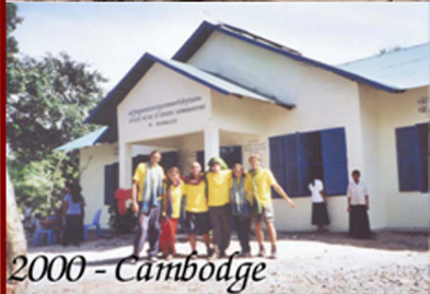
2000 - Cambodge