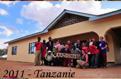
2011 - Tanzanie