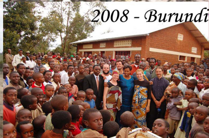
2008 - Burundi