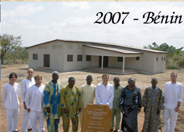
2007 - Bénin