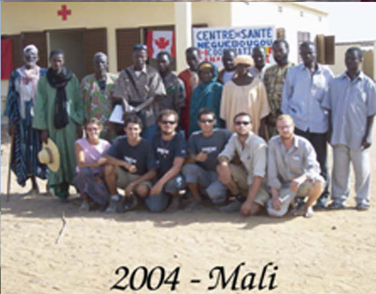
2004 - Mali