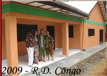
2009 - R.D. Congo