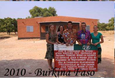
2010 - Burkina Faso