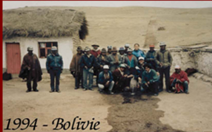
1994 - Bolivie