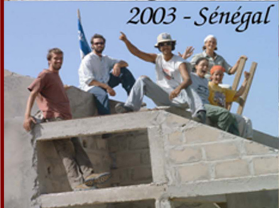
2003 - Sénégal