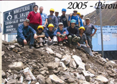
2005 - Pérou