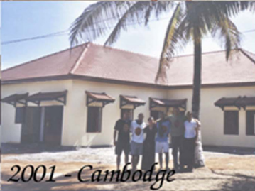
2001 - Cambodge